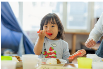
100冊でできること ※買取価格が1冊50円の場合

私たちは、地域の交流拠点および子どもの貧困対策として全国に広がるこども食堂を支援します。子どもと、こども食堂と、応援してくれる企業・団体・個人をつなぎ、それらすべての人々とともに、こども食堂が全国のどこにでもある状態を実現します。そして、誰もとりこぼされない地域と社会を創ります。