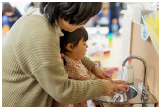
1000冊でできること ※買取価格が1冊50円の場合

子どもたちに体験を届けられます (体験プログラム一回分の経費) 人や地域社会とのつながりが弱く、簡単に様々な体験をすることができない子どももいます。企画プログラムを通じて、これまでに経験したことのない体験を届けられるほか、人とのつながりを生み出すことができます。