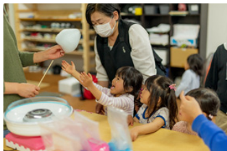
500冊でできること ※買取価格が1冊50円の場合

子どもたちに食事を届けられます (こども食堂一回分の食材費) こども食堂は、こどもが一人でも行くことができ、無料もしくは低料金で食事を提供しています。ご寄付される食材以外は、運営者が調達しなければなりません。成長盛りの子どもに、お肉や魚、野菜など栄養バランスの整った食事を提供することができます。