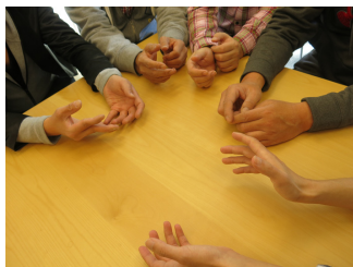
600冊でできること ※買取価格が1冊50円の場合

HIV陽性者への同行支援を行います 通院や入院、外出時に介助が必要なHIV陽性者への同行支援や、在宅での援助が必要なHIV陽性者に対し、ボランティアを派遣する際の交通費（往復）になります。