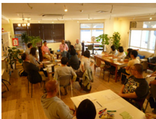
1000冊でできること ※買取価格が1冊50円の場合

HIV感染直後の人のためのサポートプログラムを提供できます 感染がわかったばかりのHIV陽性者に対し、同じ立場ならではの交流や、医療とのつきあい方など、その後の生活のサポートができるようなプログラムを提供できます。